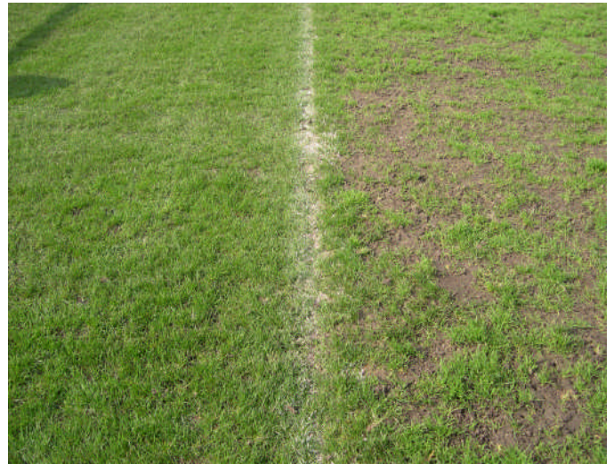
gazon sportif naturel stressé traité avec XtraGrass 500 fc